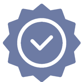
Kwaliteit in de praktijk